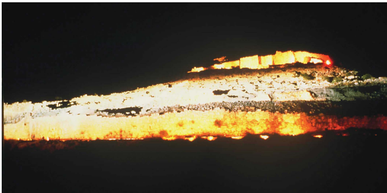
Polytope de Mycènes

Komponist elektroakustischer Musik und Schüler von Pierre Schaeffer (ebenfalls ein Pariser Kollege von Iannis Xenakis), für sein erstes großes Freiluftkonzert in Paris von ihm inspirieren. Bald werden verschiedene Musikstile in verschiedenen Regionen der Welt dieses Konzept reproduzieren, um multidisziplinäre Freiluftkonzerte zu veranstalten, wobei sie elektroakustische Klänge, Musikerensembles, Lichteffekte und Inszenierung zusammenbringen. Das Tal von Mykene war seit 1978 nicht mehr Schauplatz von Polytopen , aber so wie in den griechischen Theatern immer noch die Lieder und Geschichten von Homer und Sophokles erklingen, erinnert sich die antike mykenische Stätte noch heute an die erschütternden – und triumphalen – Klänge des kaum fassbaren und einzigartigen Werks von Iannis Xenakis, Mathematiker, Komponist und Architekt, für immer unklassifizierbar.