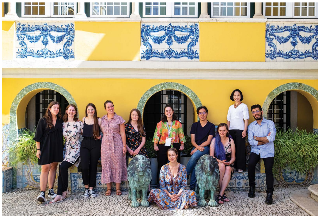
YOUNG participants 2022

Übersetzt aus dem Englischen von Irene Auerbach, Vereinigtes Königreich